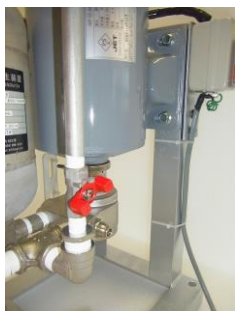
エアー調整バルブ